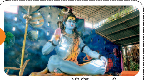
पहाड़ पर द्वादश ज्योतिर्लिंग, 40 फीट...