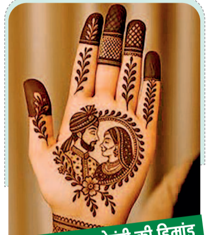
पोट्रेट डिजाइन मेहंदी की डिमांड

देखकर ही मेहंदी चुन लेती हैं, लेकिन यह काफी नहीं है। अगर मेहंदी डिजाइन सोच-समझकर न चुनी जाए तो हाथों की खूबसूरती और पूरा ब्राइडल लुक दोनों प्रभावित हो सकते हैं। इसलिए मेहंदी डिजाइन चुनने से पहले कुछ जरूरी बातों का ध्यान रखना बेहद जरूरी है। अक्सर दुल्हन सोशल मीडिया या कैटलॉग देखकर वही डिजाइन कॉपी करवा लेती हैं, बिना यह सोचे कि वह डिजाइन उनके हाथों पर वैसा दिखेगा या नहीं। हर स्किन टोन पर हर तरह की मेहंदी समान रूप से उभरकर नहीं आती। मेहंदी की बहुत बारीक डिजाइन या ज्यादा भरा हुआ पैटर्न स्किन टोन के हिसाब से फीका भी लग सकता है। छोटी उंगलियों पर बहुत हैवी डिजाइन हाथों को और छोटा दिखा सकता है, वहीं लंबे हाथों पर खाली-खाली डिजाइन अधूरा लग सकता है। हाइट को इमरॉ करना कम हाइट वाली दुल्हन पर बहुत भारी और भारी हुई मेहंदी हाथों को छोटा दिखाती है, जबकि लंबी दुल्हन पर मिनिमल या खाली डिजाइन बैलेंस नहीं बनाता। मेहंदी डिजाइन का चुनाव हाथों की शेप और स्किन टोन के अनुसार करने चाहिए। फुल हैंड, हाफ हैंड या मिनिमल आउटफिट और ज्वेलरी से मैच करते हुए मेहंदी आकर्षक होता है।